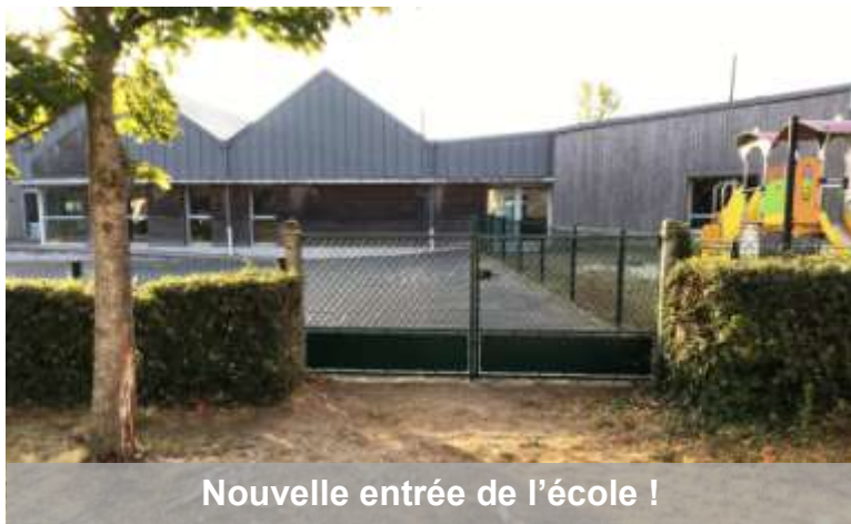
Nouvelle entrée de l'école !

Aussi, il y a eu l'Assemblée Générale de l'AMS le vendredi 16 septembre. C'est l'association sportive qui gère une section UFOLEP (le sport pour les adultes et les adolescents), la section USEP (le sport pour les enfants de l'école comme nous) et la section Brasse bouillons (qui s'occupe de Belle aventure et des bateaux de marinières).